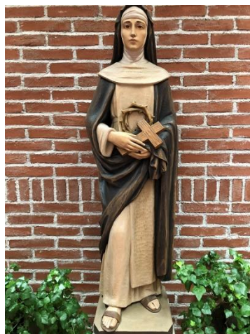
St. Katharina von Siena