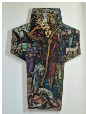
Zu den Hl. 14 Nothelfern