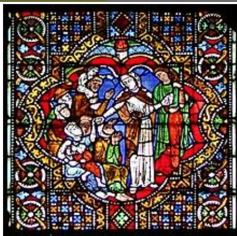
Heilige Elisabeth 19. Nov. 1235–1249 in der Elisabethkirche in Marburg , Elisabeth pflegt Kranke im Elisabethfenster (vor 1250) in der Elisabethkirche in Marburg

Sa 16.11. 18.00 Vorabendmesse für die Armen Seelen.