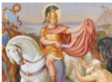
Martin teilt den Mantel mit einem frierenden Bettler