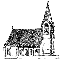
Johanniskirchen, St. Johannes d. Täufer

Treffpunkt 19:30 Uhr am Kirchplatz mit Prozession zur Wallfahrtskirche Guteneck. Festgottesdienst zum Patrozinium mit Segnung der Kräuterbuschen. Bei schlechter Witterung entfällt die Prozession. Der Gottesdienst findet dann um 20.00 Uhr in Guteneck statt. Für die Pfarreien Emmersdorf und Johanniskirchen ist es der Festgottesdienst, eingeladen sind aber alle Pfarrangehörigen im Pfarrverband und Gäste.