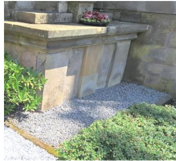
Kriegerdenkmal vor dem linken Haupteingang der Kirche