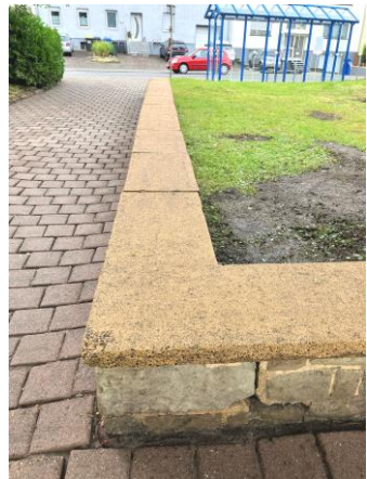
Blick zur Lebacher Straße hin