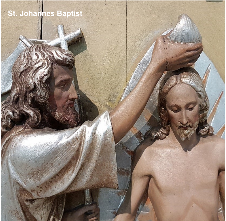
St. Johannes Baptist