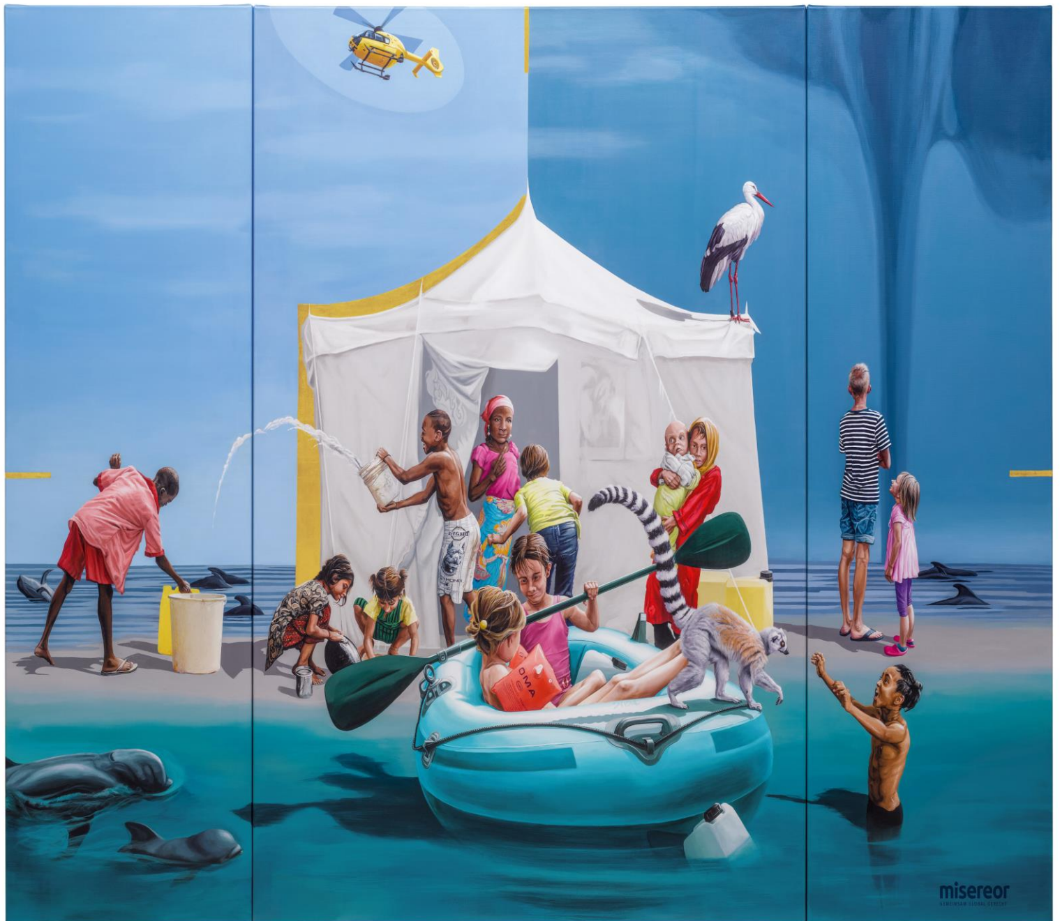
Das Misereor-Hungertuch 2025 „Gemeinsam träumen-Liebe sei Tat“ von Konstanze Trommer

Pfarrbrief für 3 Wochen – vom 16.03.2025 – 06.04.2025 2. – 5 Fastensonntag