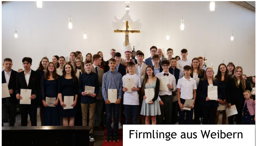
Firmlinge aus Weibern