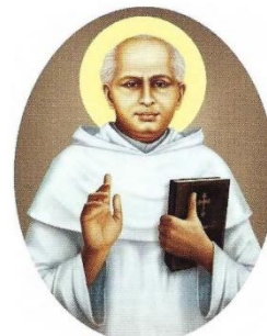
Hl. Kuriakose Elias Chavara