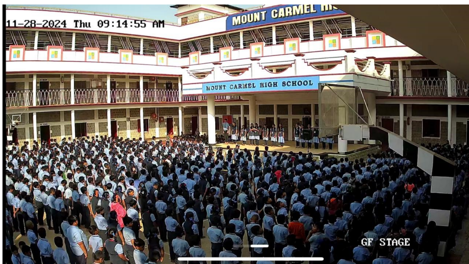
Missions-Schulzentrum in Andrapredesh