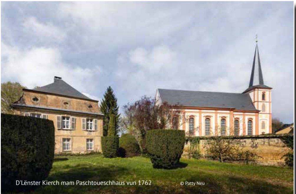
D'Lënster Kierch mam Paschtoueschhaus vun 1762