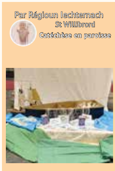
Par Régioun Iechternach St Willibrord Catéchèse en paroisse

Am Joer vun der Kommunioun gëtt et niewt der Kateches eng speziell Virbereedung op d'Fest vun der éischer Hl. Kommunioun: d'Kanner huelen regelméisseg un de Gottesdengschter deel an u speziellen Aktivitéiten respektiv Prouwen.