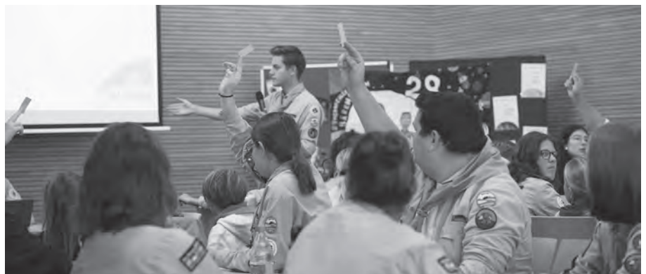
Unter anderem Teil jeder Stammesversammlungen: Wahlen.

jeder Mitgliederversammlung auf dem Programm. Ein Blick in die Zahlen zeigte, dass es der „DPSG Balingen – Heilig Geist“ finanziell zur Zeit sehr gut geht und alle Aktionen, die der Stamm durchführen möchte, auch finanziell machbar sind. Auch von Seiten der Kassenprüfung gab es keinerlei Beanstandungen. Ein Ausblick auf die kommenden Aktionen der Balingen Pfadis durfte natürlich nicht fehlen. Die nächste davon steht mit dem Stammeshike vom 12. bis 13. Oktober unmittelbar bevor. Am 20. Dezember treffen sich die Pfadfinder zur traditionellen Pfadiweihnacht, am 6. Januar 2025 steht die Sternsinger-Aktion auf dem Programm und das Zeltlager vom 1. bis 10. August 2025 ist ebenfalls schon fix geplant. Weitere Aktionen stehen bereits in Aussicht, sind aber noch nicht fest eingeplant und werden frühzeitig bekanntgegeben. (NL)