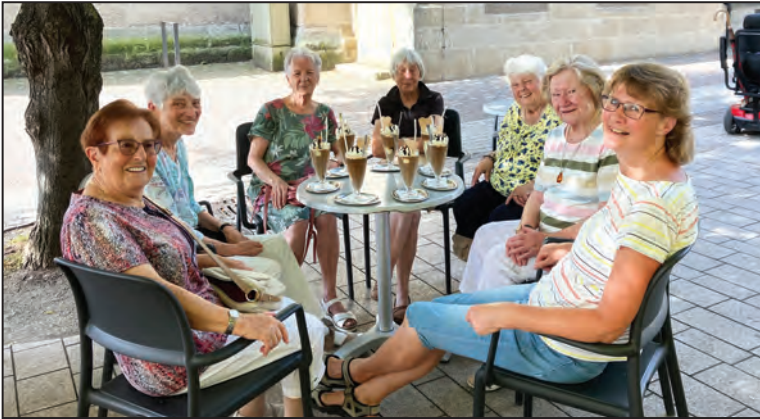
▲ Kaffeerunde nach dem Mittwochsgottesdienst