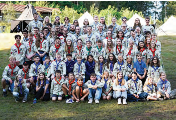
▲ Beim Zeltlager der Baling'er Pfadfinder im Dahner Felsenland ▲