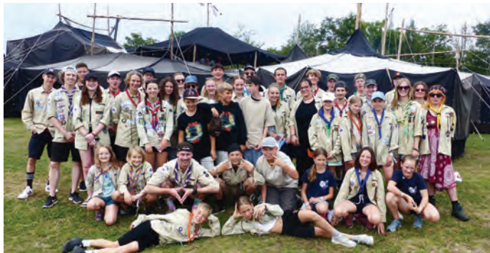
▲ Frommerner Pfadfinder im Zeltlager in Rhens am Rhein