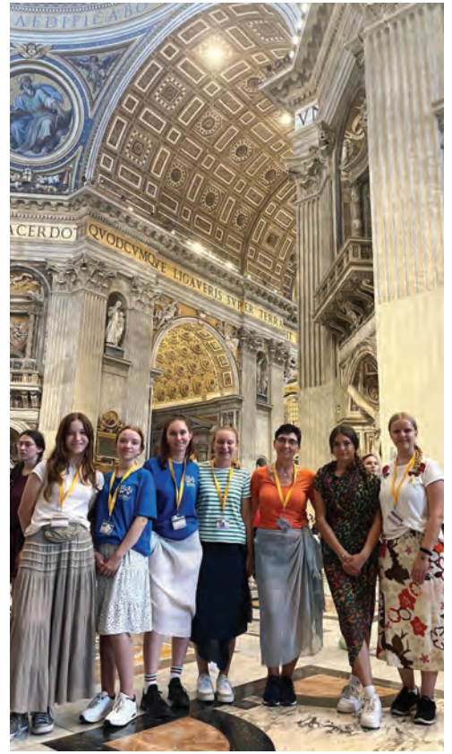
▲ Ministranten aus Frommern in Rom