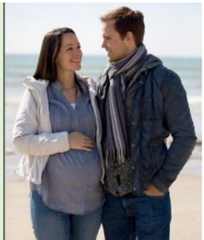
Für Frauen/ Paare, die ein Kind erwarten