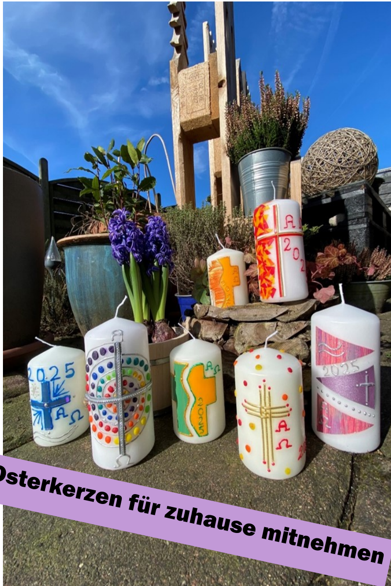
Osterkerzen für zuhause mitnehmen