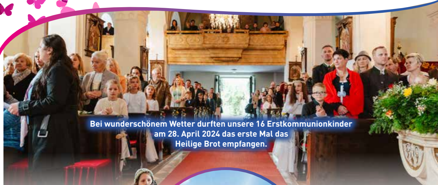
Bei wunderschönem Wetter durften unsere 16 Erstkommunionkinder am 28. April 2024 das erste Mal das Heilige Brot empfangen.