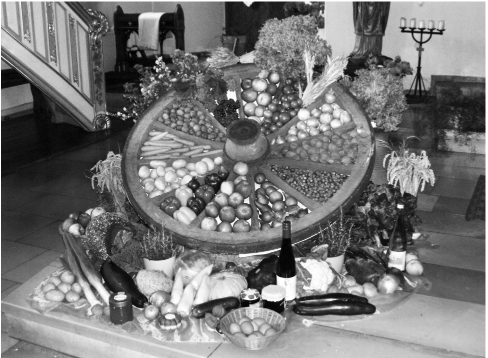
Erntedank in Brauneberg