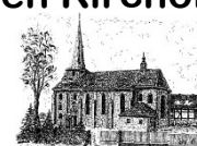
St. Laurentius Gieboldehausen