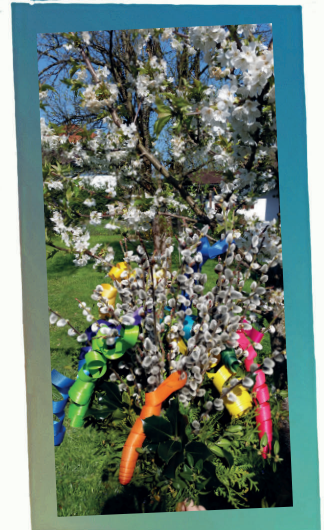
Gottesdienste und Veranstaltungen Katholische Stadtkirche Bad Reichenhall April 2025