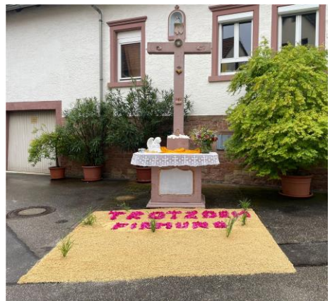
Fronleichnam in Waibstadt