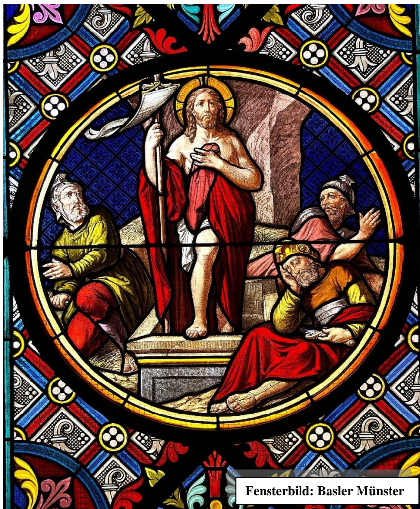
Fensterbild: Basler Münster