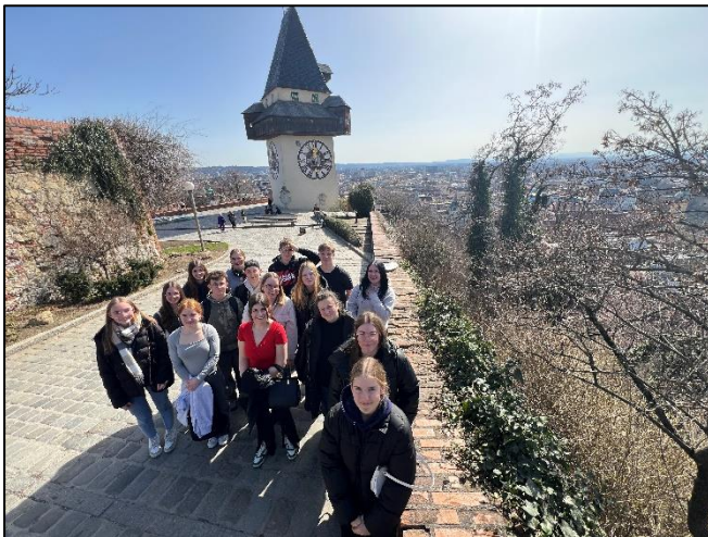
(Text und Fotos: Jennifer Kinder)

„Es war ein unvergesslich, schönes Erlebnis!“, so eine Rückmeldung der Teilnehmenden.