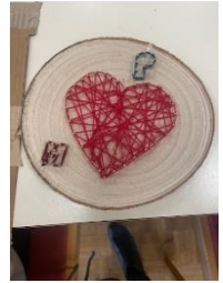
Text und Foto D. Hoibl