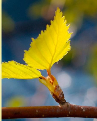
Text: Hannelore Bares, aufbrechen-ins-leben.de, in: Pfarrbriefservice.de