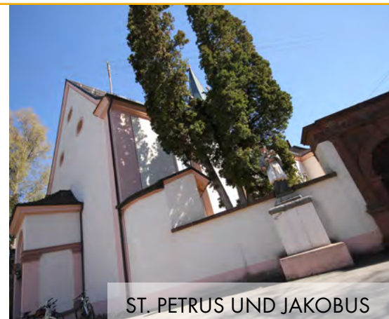
ST. PETRUS UND JAKOBUS