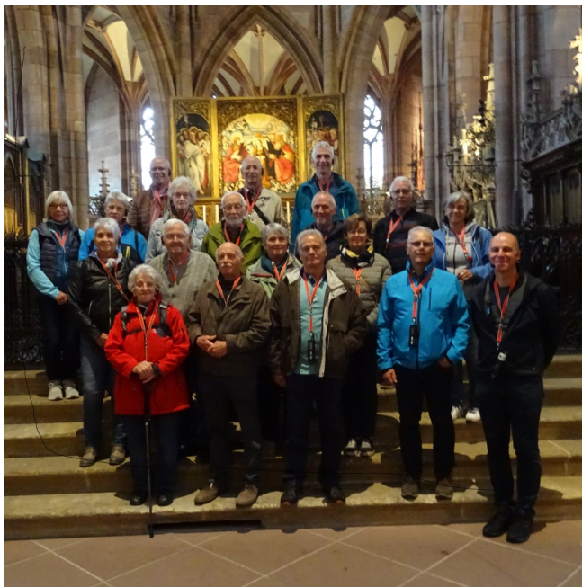
Das Bild zeigt die Gruppe im Altarraum