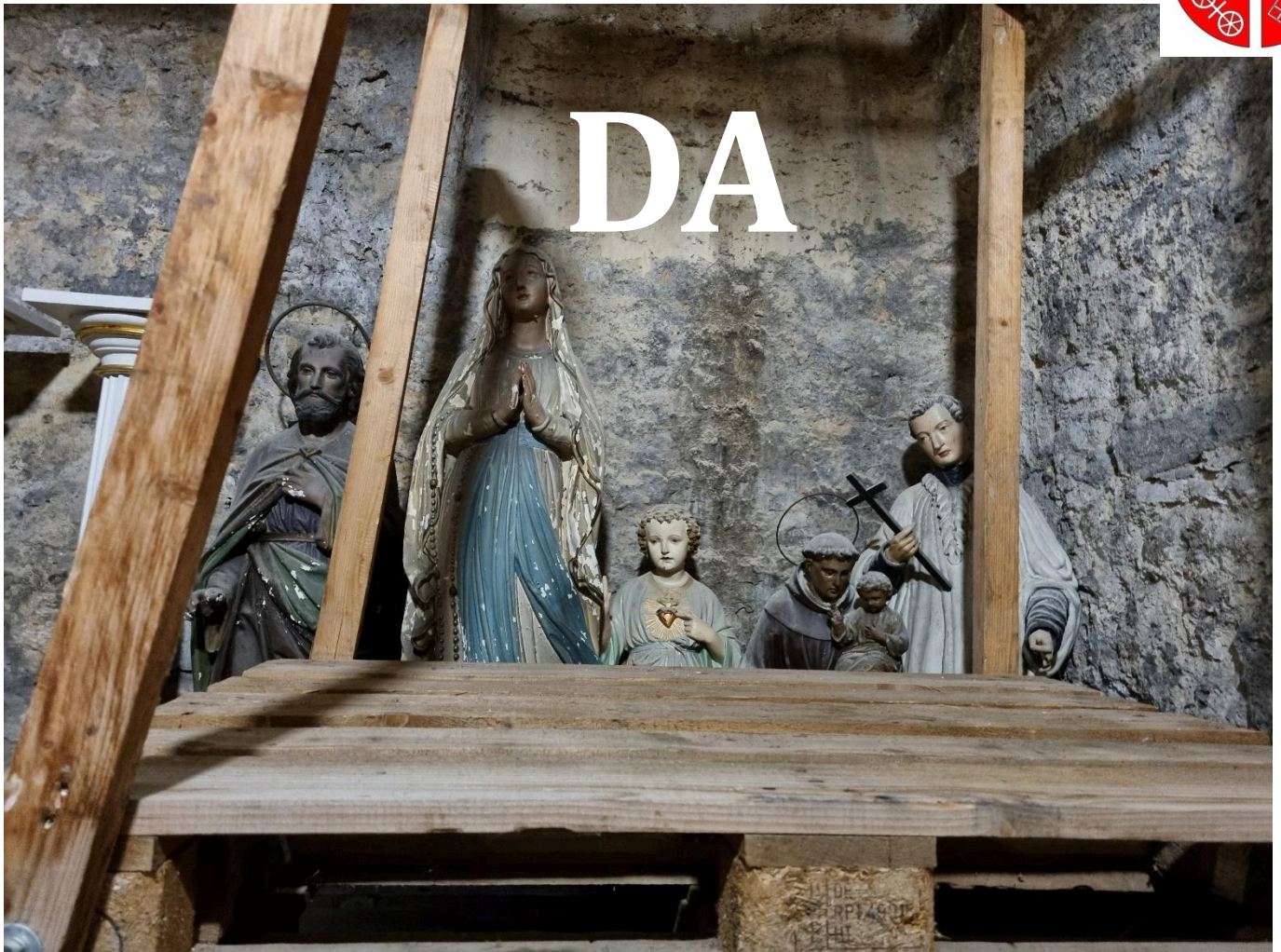
Kellerraum kath. Pfarrhaus in Laubenheim