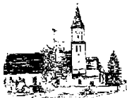
St. Georg – Feldheim