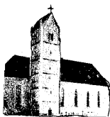
St. Peter und Paul Genderkingen