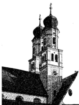
Mariä Himmelfahrt Niederschönenfeld