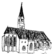
St. Johannes d. Täufer Rain