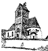
St. Quirin – Staudheim