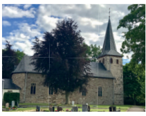
Hl. Maur, Märtyrer Bergstein