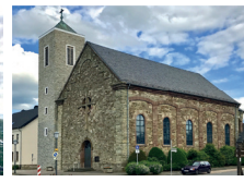
Hl. Kreuz Hürtgen