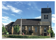
St. Josef Vossenack