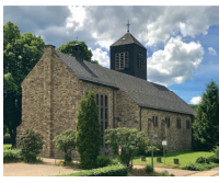
St. Antonius Gey