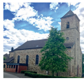
St. Apollonia Großhau