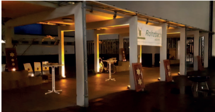
ein Lichtstrahl der Hoffnung