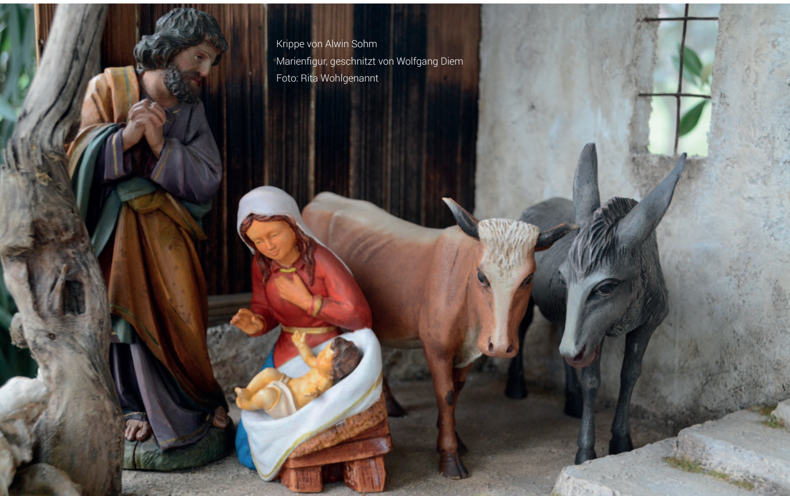
Krippe von Alwin Sohm Marienfigur, geschnitzt von Wolfgang Diem