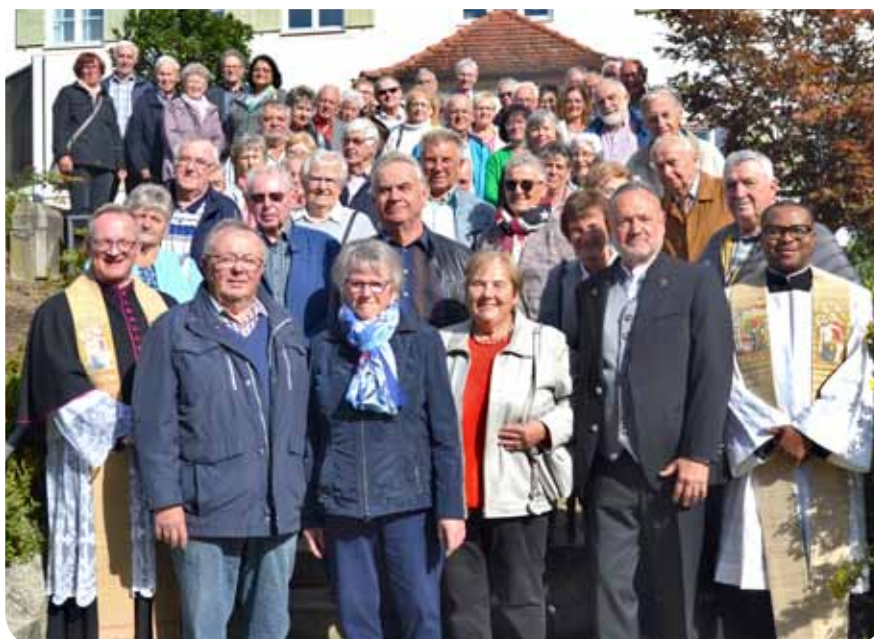
Nach der Dankandacht versammelten sich die Jubelpaare zum Gruppenfoto.