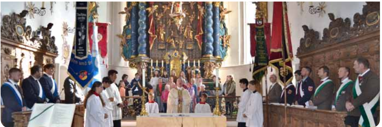
Die Musikgruppe „Heischniggl“ gestaltete mit dem Kinderchor die Patroziniumsfeier St. Michael in Violau. Vereine zeigten mit ihren Fahnenabordnungen ihre Verbundenheit