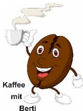
Kaffee mit Bertis