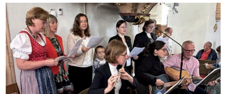
» » Familiengottesdienstkreis (Chor) Straden