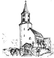
Döfering St. Ägidius