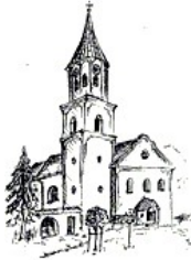
Schönthal St. Michael