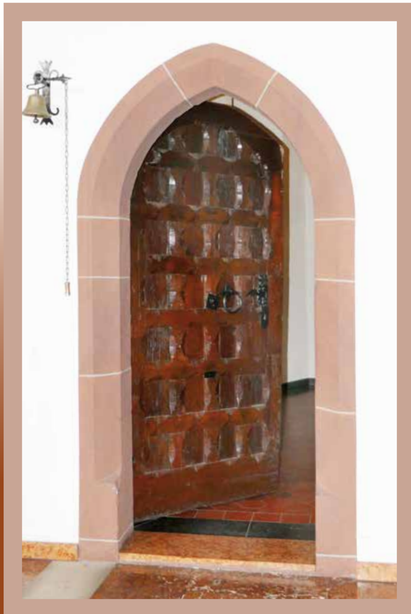
Sakristei-Tür Pfarrkirche St. Maria Himmelfahrt Herxheim