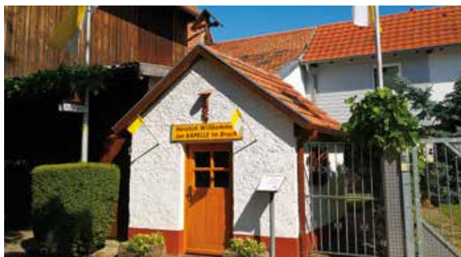
Kapelle im Bruch, Herxheim

Weitere Informationen sind demnächst im Mitteilungsblatt der Verbandsgemeinde Herxheim sowie in einem Flyer, der im Rathaus abgeholt werden kann, zu lesen.