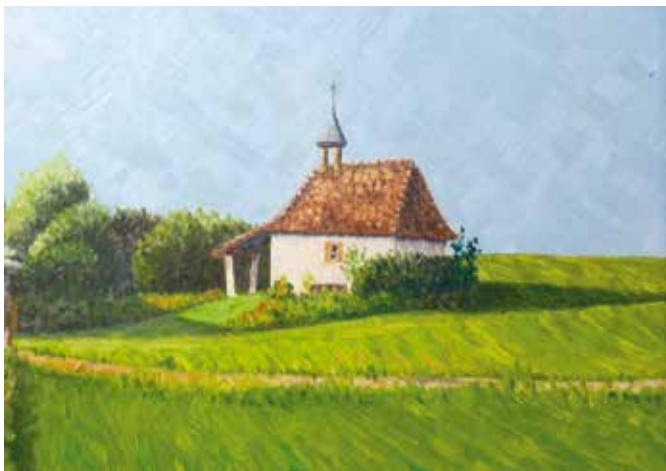
(Gottfried Schwitzke 1981)

Es wurden Postkarten mit verschiedenen Motiven der Landauer Kapelle gedruckt, die erworben werden können.