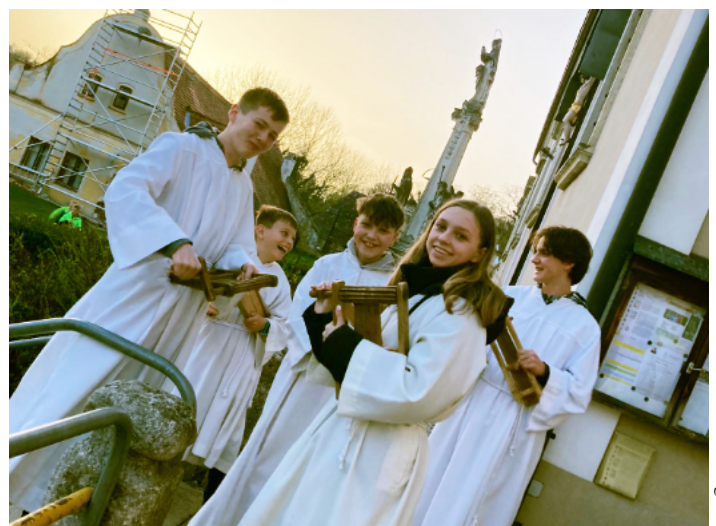
Jugendkreuzweg am Karfreitag auf den Kalvarienberg