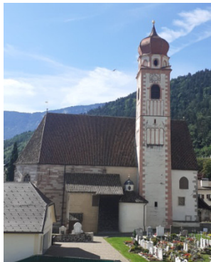
Maria Himmelfahrt Tisens