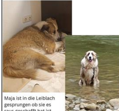
Maja ist in die Leiblach gesprungen ob sie es raus geschafft hat ist noch unklar

Reagiert ängstlich auf Fremde Personen und mit Flucht ! Nicht bedrängen oder verfolgen !