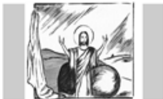
Ostersonntag: Im Glanz der Auferstehung