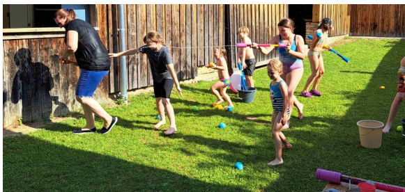
Text und Fotos: Patricia Larott

Ein wenig emotional wurde es auch für uns, da es unsere Gruppe, in dieser Konstellation, im September nicht mehr so geben wird. Die größeren Kinder stehen vor einem Schulwechsel, zu dem wir ihnen alles Gute und Gottes Segen wünschen.