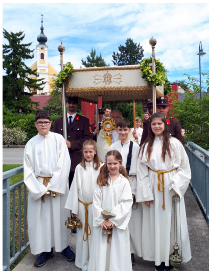
Aufstellung mit Baldachin, Fahnen, Kreuz, Lautsprecher, Weihrauch und Glocken - unsere Minis sind immer vorne dabei!