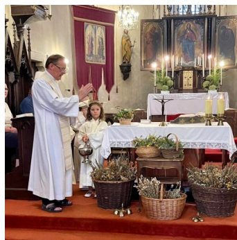
Kräutersegnung beim Vorabendgottesdienst zum Hochfest Mariä Aufnahme in den Himmel. Die zahlreich erschienenen Messbesucher freuten sich über ein gesegnetes „Kräuterbüschel“.