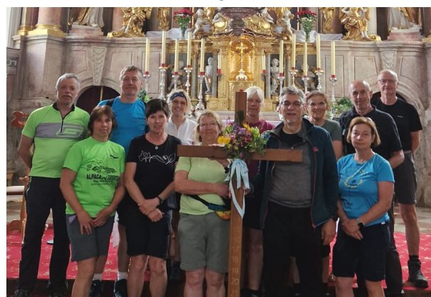
Am Ziel der Etappe in St. Johann in Tirol

Die 5 Tage , an denen wir insgesamt 130 km zurücklegten, waren für uns alle wieder ein überaus besinnliches und gemeinschaftliches Erlebnis .