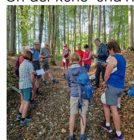
Morgenandacht In Bad Reichenhall

Anschließend führte uns der Weg nach Unken , wo die dritte Übernachtung anstand. Der nächste Tag hielt für uns ein landschaftliches Highlight bereit – der Steig entlang der Saalach von Unken bis Lofer führte uns eindrucksvoll die Schönheit der Schöpfung vor Augen. Wir überquerten die Landesgrenze nach Tirol und übernachteten in Waidring .