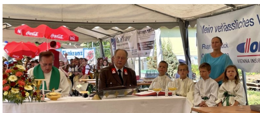
Festgottesdienst beim Glaubendorfer FF-Fest am Sonntag, den 21. Juli 2024