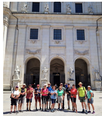
Vor dem Salzburger Dom

Am nächsten Tag ging es weiter zur bekannten Wallfahrtskirche Maria Plain und später durch die Stadt Salzburg . Wir durchquerten die Altstadt und hielten inne vor dem imposanten Dom. Der Tag endete mit einer Abendandacht in Wals - Siezenheim. Nach der Morgenandacht pilgerten wir von Salzburg nach Bad Reichenhall in Bayern. Beeindruckt waren wir von der St. Nikolaus Basilika , ein spätromanischer Kirchenraum aus dem Jahr 1181, ein Ort der Ruhe und Harmonie, der uns zu einem stillen Gebet einlud.