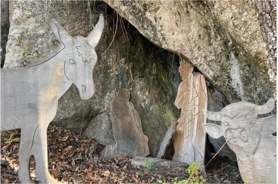
Auf dem Pilgerweg von Florenz nach Rom: Eremo Einsiedelei Cerbalolo bei Pieve Santo Stefano