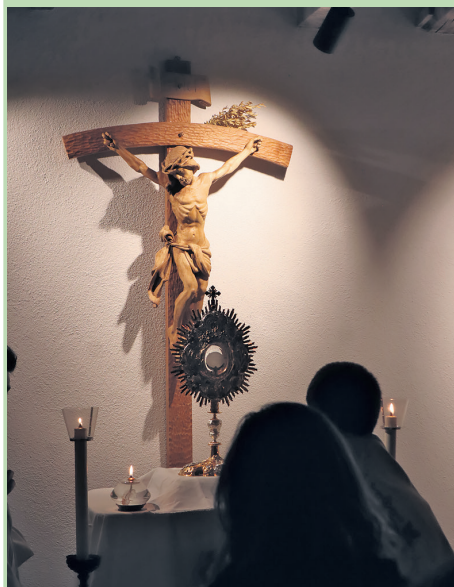
Anbetung im Turmzimmer von Näfels