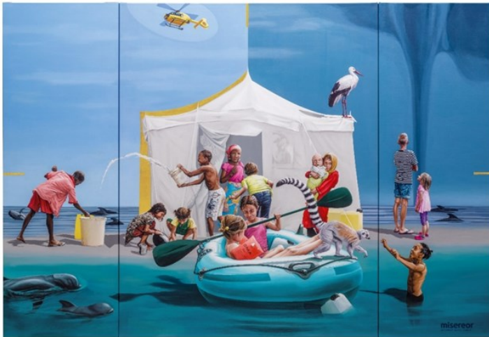
Misereor-Hungertuch 2025 "Gemeinsam träumen -Liebe sei Tat" von Konstanze Trommer (c) Misereor

Später wurden die großen Tücher gestaltet und mit meist biblischen Motiven bemalt oder bestickt, wodurch eine katechetische Funktion in den Vordergrund rückte. Das große Zittauer Hungertuch aus dem Jahr 1472 ist dafür ein bemerkenswertes Beispiel. Ebenso das Freiburger Hungertuch aus dem Jahr 1611, das europaweit als das größte seiner Art gilt.