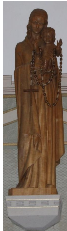
Marienfigur in Merzenich

Herzliche Einladung an alle Gläubige zur Teilnahme an den Andachten.