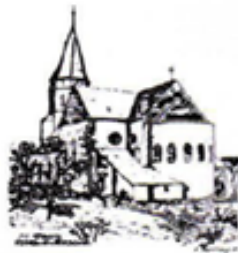
St. Georg Dreiborn

Der nächste Pfarrbrief geht vom 06.07.2024 bis zum 25.08.2024 . Messgebetswünsche und Beiträge müssen bis zum 21.06.2024 im Pfarrbüro eingegangen sein.