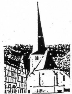
St. Johann Baptist