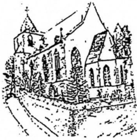
St. Philippus u. Jakobus