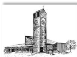
Verklärung Christi Rain