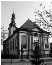
Pfarrkirche St. Pankratius Schlossstr. 8 68723 Schwetzingen