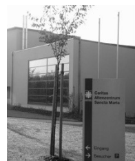
Kapelle im Caritas- Altenzentrum (CAZ) Sancta Maria Schönauer Straße 2 68723 Plankstadt