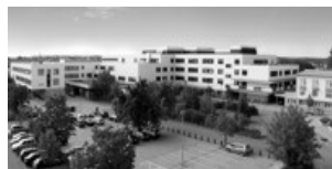
Kapelle im GRN Kreiskrankenhaus Bodelschwinghstr. 10 68723 Schwetzingen