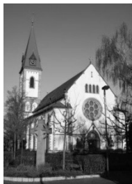
Pfarrkirche St. Kilian Mozartstr. 1 68723 Oftersheim