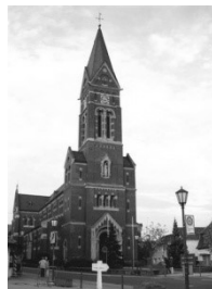
Pfarrkirche St. Nikolaus Schwetzingener Str. 34 68723 Plankstadt