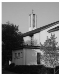
Kirche St. Maria Hans-Thoma-Str 3 68723 Schwetzingen