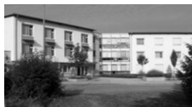
Kapelle im GRN Seniorenzentrum Bodelschwinghstr. 10/1 68723 Schwetzingen