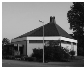
Kapelle St. Josef Marktplatz 31 68723 Schwetzingen- Hirschacker