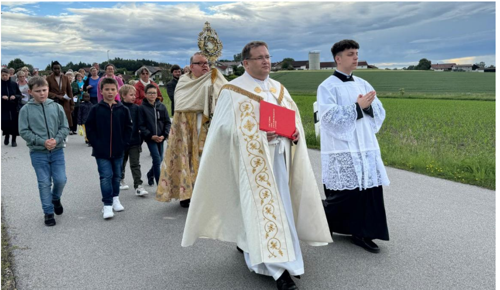
Am Abend konnten die Prozessionen in Asbach und Weihmörting stattfinden