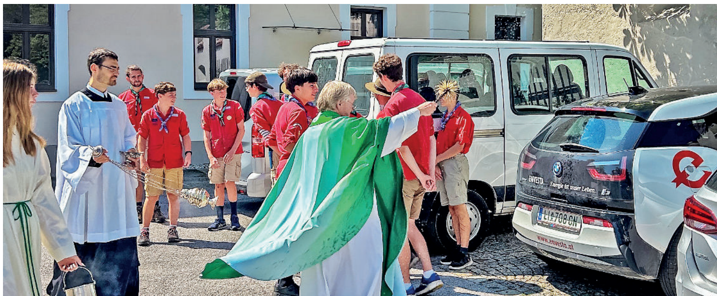
Christophorussonntag mit Fahrzeugsegnung