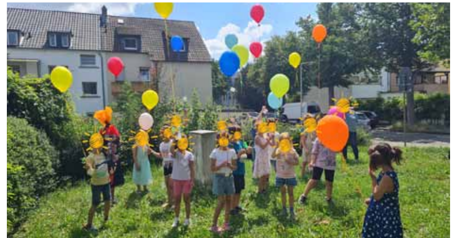
Sandra Nitsche · Fotos: F. Stoß