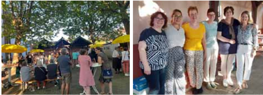
Eindrücke vom Dankeschönabend für Ehrenamtliche