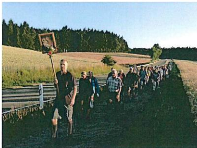
Fußwallfahrt 2019 (Zulauf auf Pursruck)

In Amberg wird um 09:00 Uhr der Pilgertottesdienst für die Fußwallfahrer aus Weierhammer und Kohlberg gefeiert.