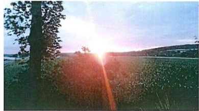
Sonnenaufgang in Krickelhof 2017

Auch heuer übernimmt die Freiwillige Feuerwehr Weierhammer wieder den Begleitschutz, den Shuttle-Verkehr und die Organisation der Pausen. Dafür gilt ihr schon im Voraus unser aller Dank!