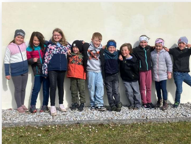
Die Erstkommunionkinder nach der Besichtigung der Kirche und der Kirchturmglöcken.