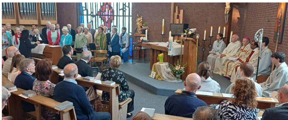
Pontifikalamt anlässlich des 50. Gemeindejubiläums am 23.06.224

Der Gemeindebrief für September 2024 erscheint am 24./25.08.2024.